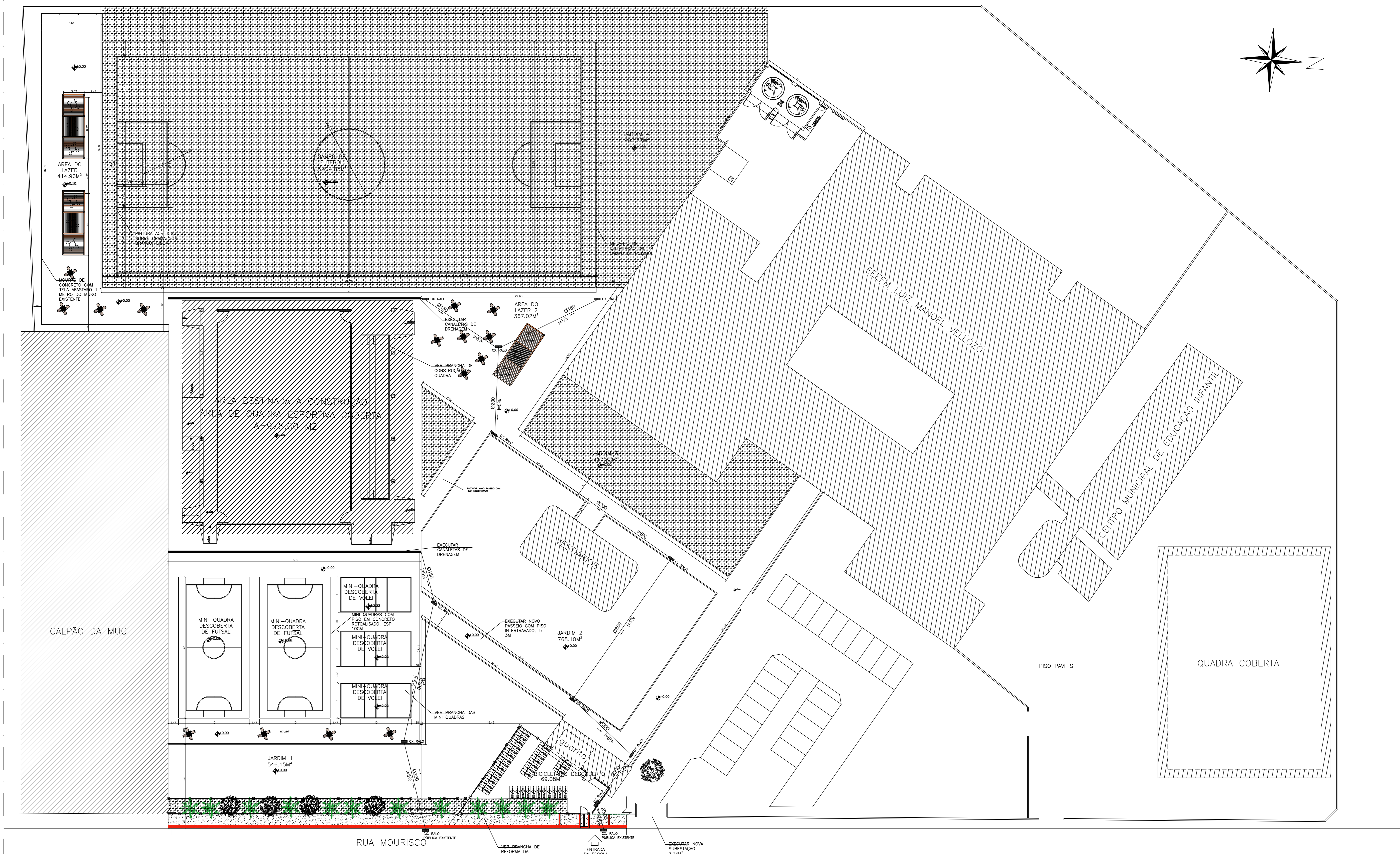
IMPLANTAÇÃO PROPOSTA – ESC: 1/100